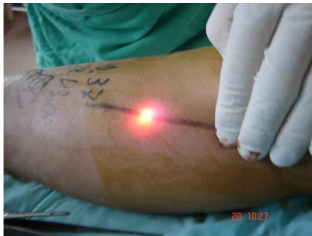
Фиг.1 Чрезкожная визуализация локализации лазерного световода.

Перед манипуляцией производили накожную маркировку всех варикозно измененных вен. Анестезия, используемая при операции у 55 больных была спинальной и в трех случаях общей. От местной анестезии все больные отказались. Пункционно или через маленький доступ, используя специальный сет , в просвет VSM вводился лазерный световод, который под эхографическим контролем позиционировался на 1-2 см. ниже клапанов устья VSM, а между кожей и веной вводился 0,25% р-р Лидокаина или физиологический раствор как превантивная мера против ожогов кожного покрова в процессе лазерной эмиссии. Последняя осуществлялась в импульсном режиме при постепенном выведении световода в дистальном направлении, причем на каждый сантиметр приходилось по 1-2 импульса продолжительностью 3-4 сек.в бедренном и 1-2 сек.в подбедренном сегментах конечности.